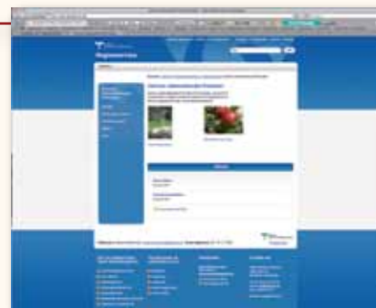
Centrumet har även en egen hemsida, www.vgregion.se/clp , som man vårdar noga och försöker uppdatera dagligen.